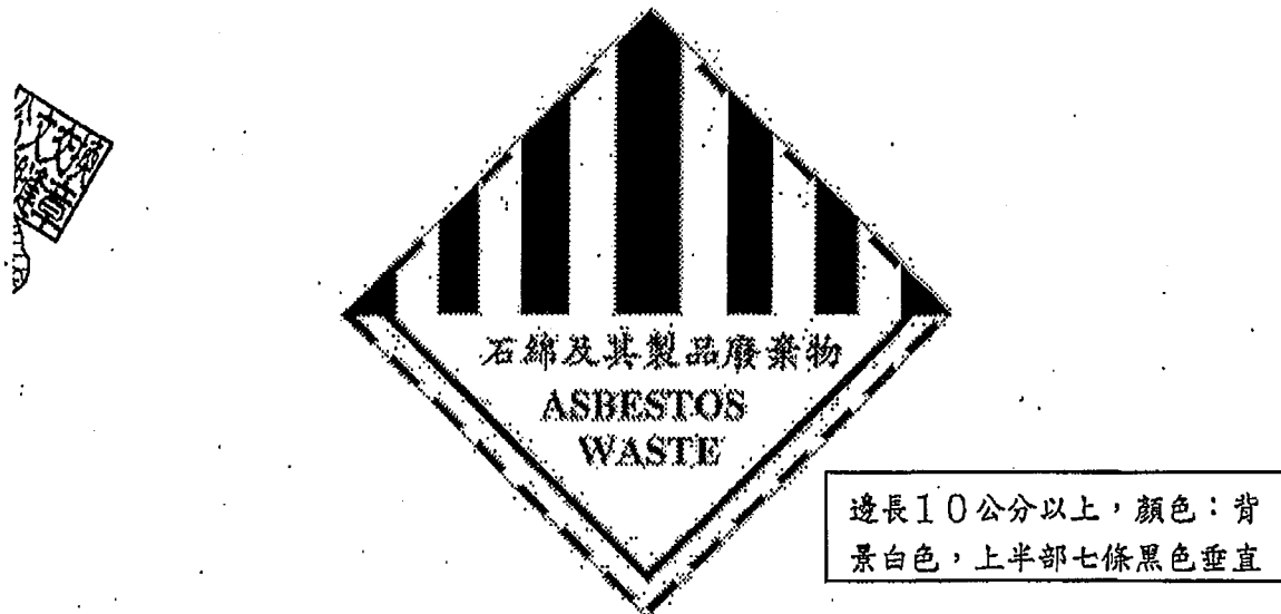
圖 2、有害事業廢棄物特性之標誌-石綿及其製品廢棄物

(三) 太空包外袋應標示事業名稱、廢棄物代碼 C-0701 (石綿及其製品廢棄物)、貯存日期、數量、成分及區別有害事業廢棄物特性標誌 (如圖 2)。