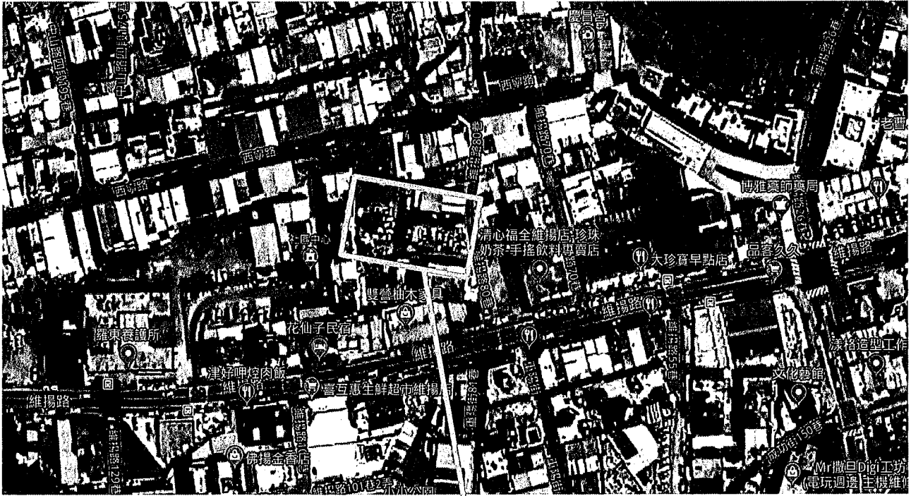
羅東鎮維揚段 496 地號