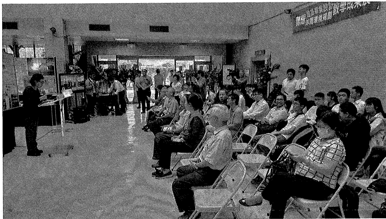
會場貴賓及長官致詞