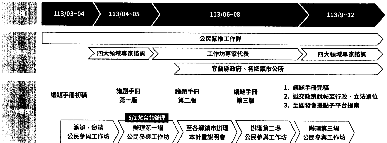
圖 2-北宜新軌道社會溝通計畫工作推動流程圖