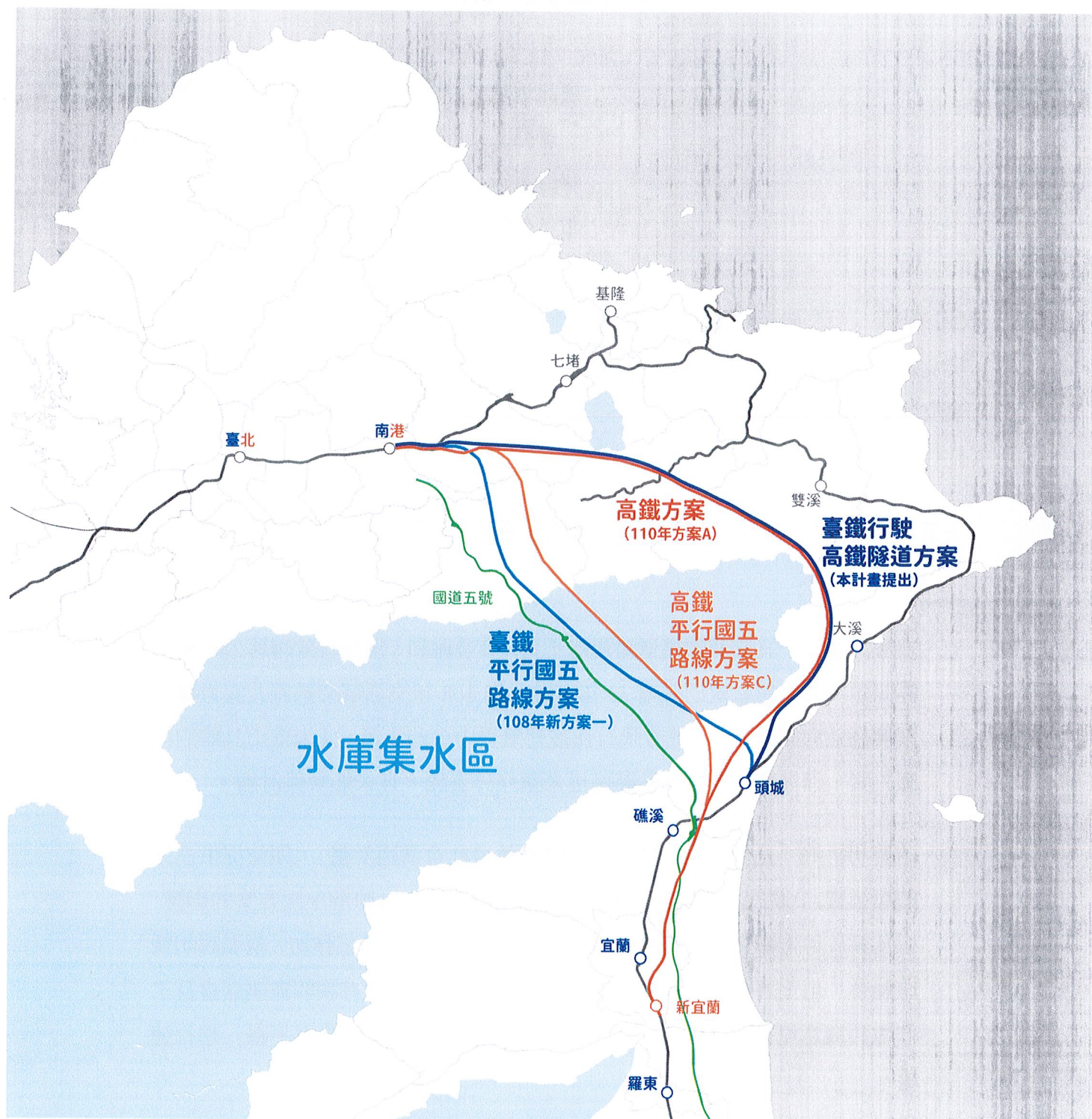
圖 1-北宜新軌道方案路線圖